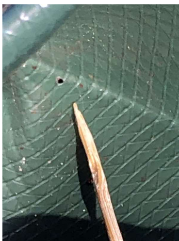
Bild 3: Größenvergleich Auslaflloch und Zahnstocher, gebrauchter Wassersack

5. Achtung! Beachten sie bitte bei Punkt 4, dass das Löchlein nicht aufgeweitet wird, da sich sonst die Auslaufzeit des Wassersackes verkürzt.